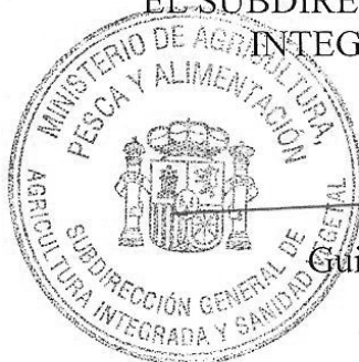
Guillermo Artolachipi Esteban

EL SUBDIRECTOR GENERAL DE AGRICULTURA INTEGRADA Y SANIDAD VEGETAL,